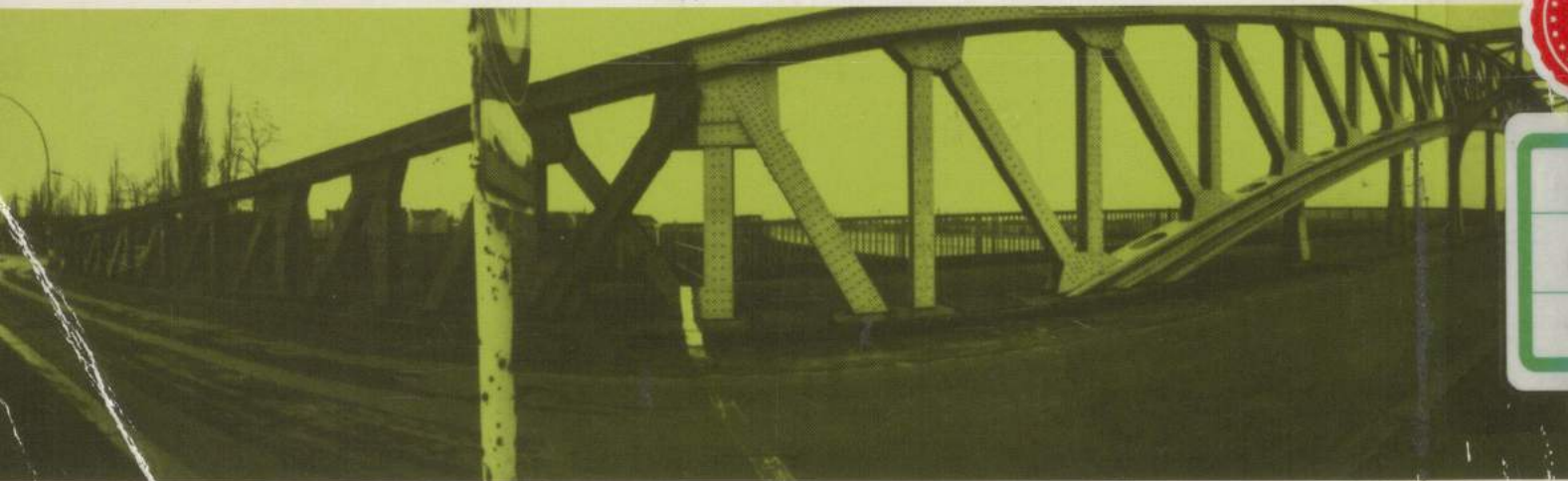
Berliner Mauer: Bornholmer Brücke, 1981, 360° Panorama